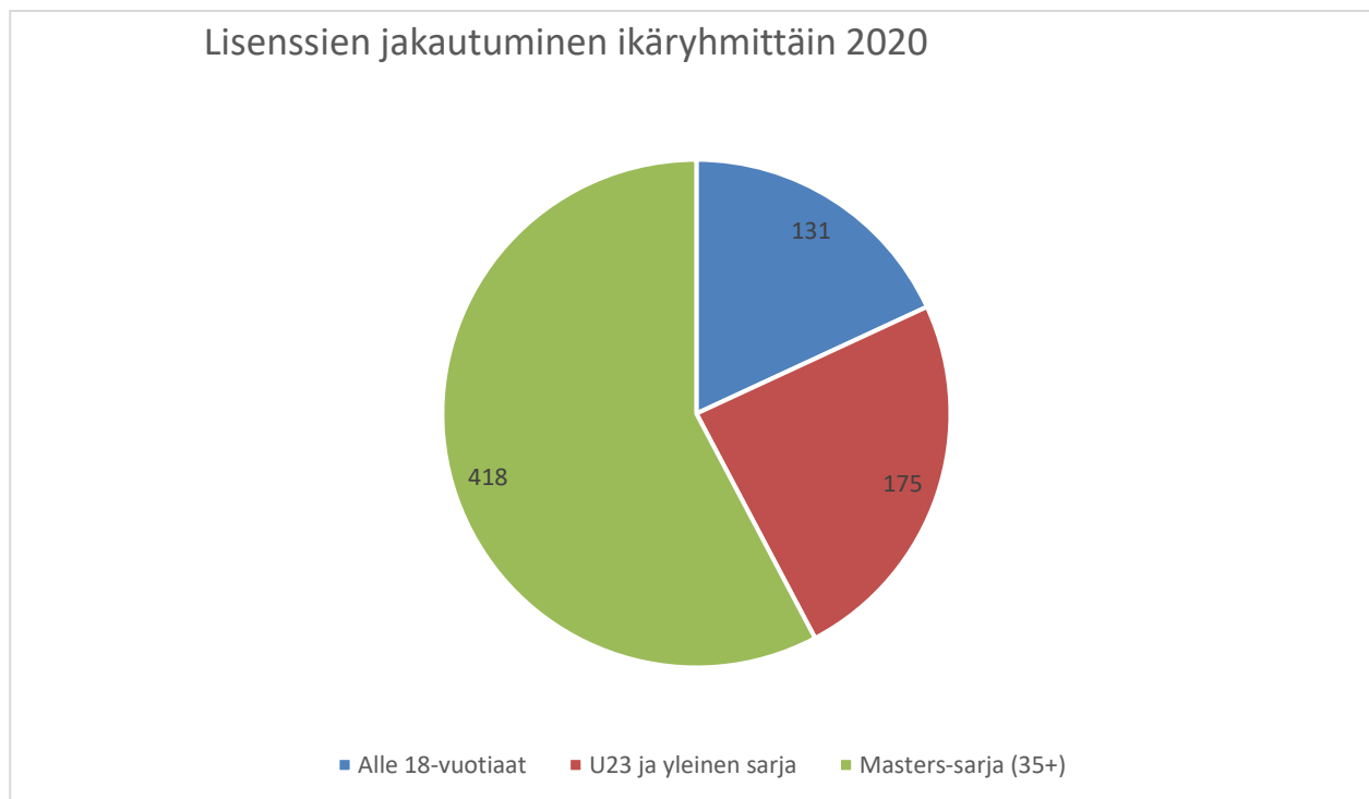
KUVIO 2 Lisenssien määrän jakautuminen ikäryhmittäin